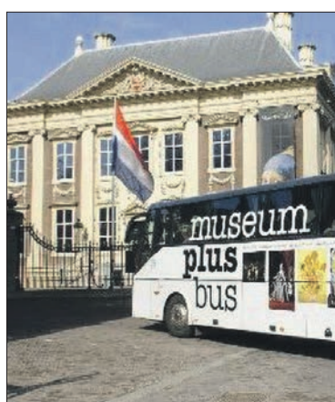
Museum Plus Bus