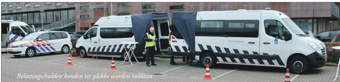
Belastingsschulden konden ter plekke worden voldaan