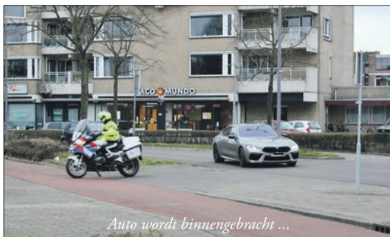
Auto wordt binnengebracht ...

Om 21.00 uur was de actie afgelopen en Zevenkamp weer een stukje veiliger geworden.