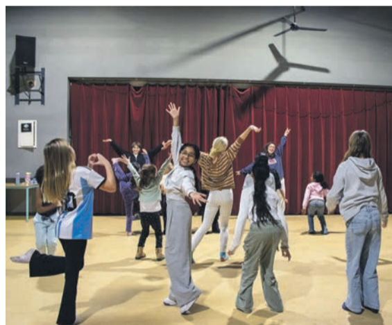
Dans- en theaterles in het Huis van de Wijk

De drie Muskietiers is een bruisende, grappige en grandioos (te) gekke voorstelling over geloven in samenwerking, over samen sterker staan en het ondenkbare voor elkaar krijgen.