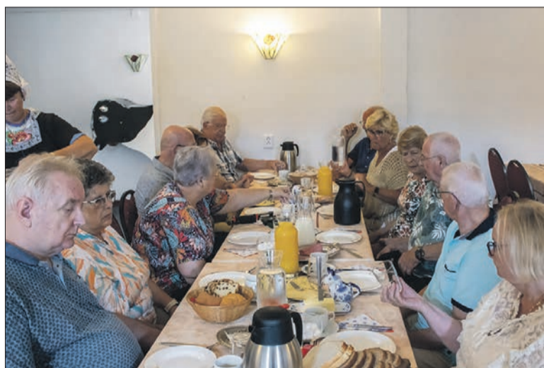
Dagje uit met senioren