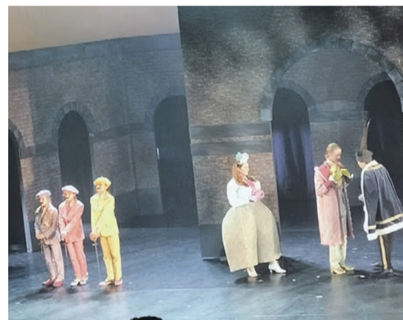
Uit de voorstelling de Drie Muskietiers