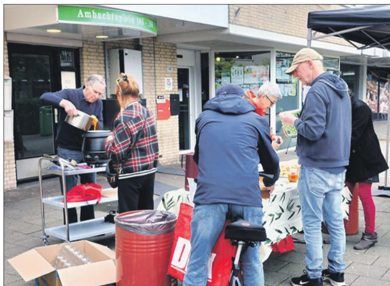
5 mei Bevrijdingssoep