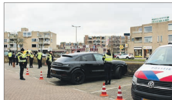
Bestuurder en voertuig worden nader gecontroleerd