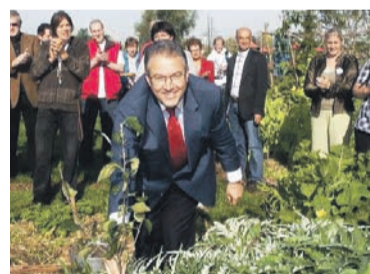
Burgemeester Aboutaleb in 2011

Allereerst even 'helemaal' terug in de tijd. We gaan naar het jaar 2011 in de tijd dat burgemeester Aboutaleb nog maar net aan zijn werk in Rotterdam was begonnen. Bij zijn kennismaking met de stad hebben we toen de plannen voor het herinrichten van het manifestatieveld aan hem gepresenteerd. Hij was meteen een supporter van ons initiatief en dat resulteerde in een bezoek aan onze kleine proeftuin en daarna aan de speeltuin. Hij plantte op ons verzoek toen meteen ook de eerste appelboom in de Taka Tuka Tuin en hiervoor zijn we hem nog steeds dankbaar! Het was één van de mooie momenten in het begin van onze tuin.