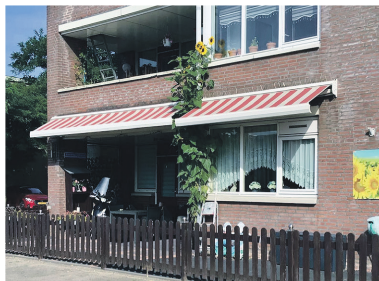
Dit jaar geen wedstrijd, maar de zonnebloem van ome Cor reikt tot het raam van zijn bovenburen en zou zeker kanshebber geweest zijn!